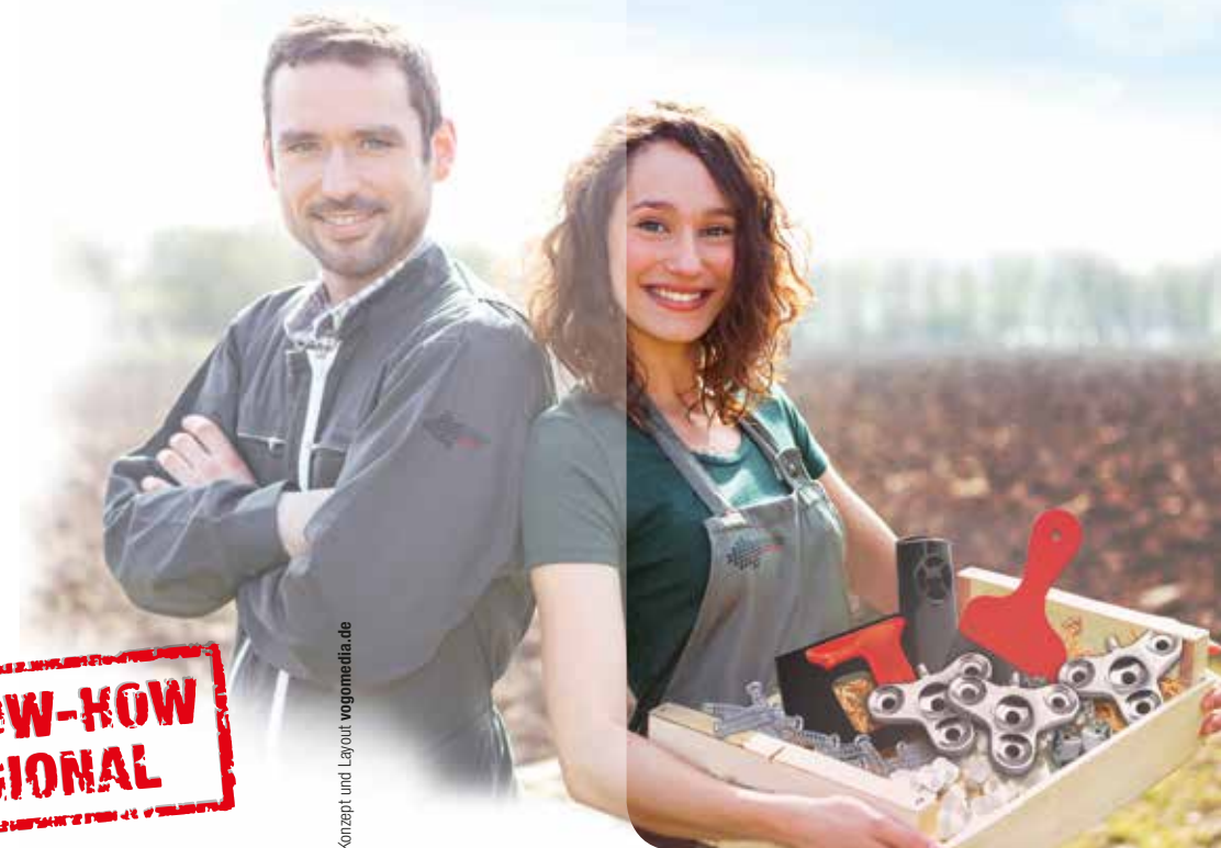
Konzept und Layout vogomedia.de